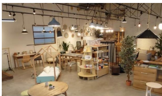
鳥取店、インテリア・雑貨コーナー

2015年（平成27）鳥取市千代水に「モコライフスタイルストア」をオープン。「カフェの運営」「雑貨・アパレルのセレクト販売」「インテリアのセレクト販売・オーダー販売」「フリースペースのレンタルサービス」を行っています。2023年には米子市東福原に「モコライフスタイルストア米子店」をオープン。同年9月に旧鳥取市役所前（鳥取市片原）の片原ビルを「とっとりマチバージョンビル」と名称変更し、ビルの内部のレンタルサービスも開始しております。